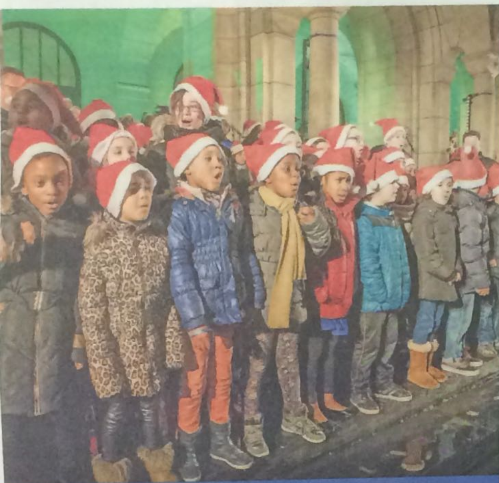
DE LEERLINGEN VAN DE CHRISTOPHOOR EN DE TOERMALIJN ZINGEN ZO HARD ALS ZE KUNNEN.

CENTRUM — Op vrijdag 12 december stonden er meer dan 200 kinderen op de trappen van het stadhuis in Rotterdam. Voor een groot publiek zongen zij liedjes of bespeelden ze een instrument. Ook de leerlingen van de Christophoor en de Toermalijn zongen mee in het koor. TEKST: SHARON VAN OOST